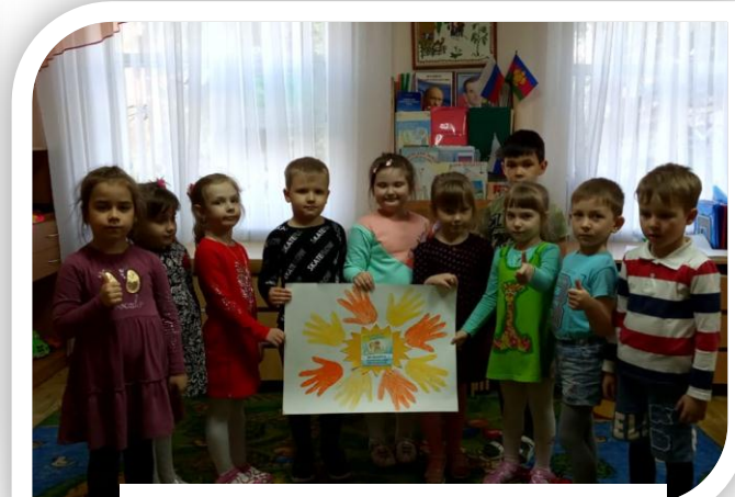
Рисование ладошками «Солнечный круг»